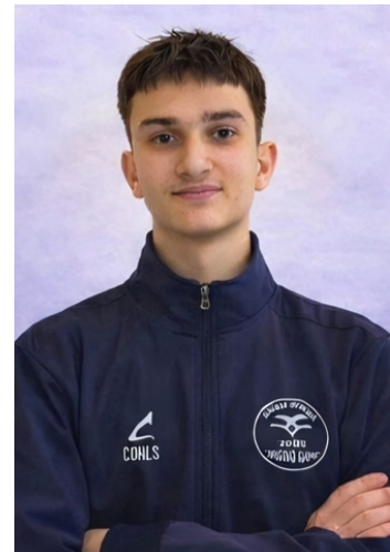
Drejtues i prodhimit