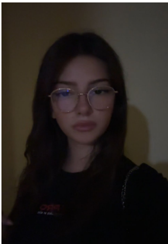
Drejtuese e marketingut