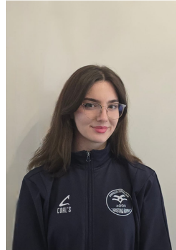
Drejtuese e financave