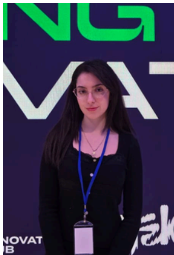
Drejtuese e marredhënjeve me publikun